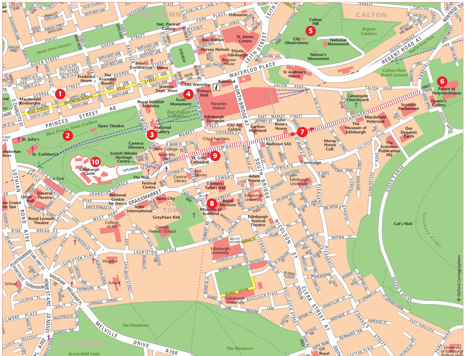
Palace of Holyroodhouse Wer einen Hang zur Romantik hat, verfolgt im Palace of Holyroodhouse die tragische Geschichte von Maria Stuart.