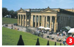
National Gallery of Scotland Die größte britische Sammlung alter Meister außerhalb Londons. Hier sehen Sie auch viele Gemälde der schottischen Meister.