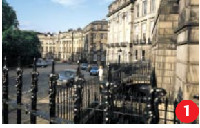
New Town Anderswo wäre die New Town mit ihrer großartigen georgianischen Architektur die Altstadt. Ihre Entwicklung seit dem 18. Jh. beeinflusste die Stadtplanung ganz Europas.

Wer im überwältigend schönen Edinburgh unterwegs ist, versteht sofort, warum die Unesco das Zentrum dieser zauberhaften Stadt zum Weltkulturerbe ernannt hat. Die beiden sehr gegensätzlichen historischen Stadtteile – die mittelalterliche Old Town, dominiert von Edinburgh Castle, und die neoklassizistische New Town aus dem 18. Jahrhundert – bestehen harmonisch nebeneinander. Das gibt der Stadt ihren einzigartigen Charakter.