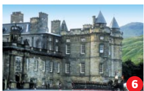
Die Royal Mile Wenn jahrhundertalte Straßen sprechen könnten! Diese ist getränkt mit Historie, Intrige und faszinierenden Geschichten. Lassen Sie sich Zeit für Ihren Gang durch die Geschichte.