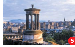
Calton Hill Ein wunderbarer Blick auf die Stadt – und vom Nelson's Monument aus wird die Aussicht noch besser.