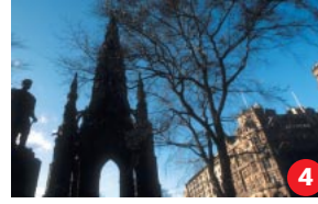
Scott Monument Das gotische, reichverzierte Scott Monument in der Princes Street ist möglicherweise das höchste Denkmal der Welt für einen Schriftsteller.