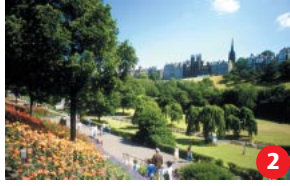
Princes Street Gardens Hier war ein See, bevor die New Town entstand. Machen Sie einen Spaziergang oder entspannen Sie auf einer Parkbank mit Blick auf die Stadt. Die Blumenuhr am Ostrand ist die älteste der Welt.